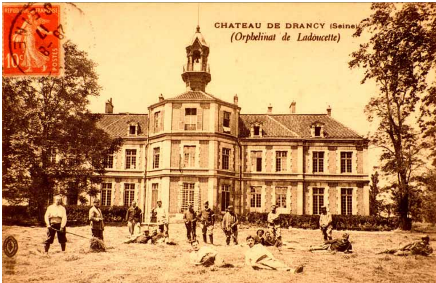
L'orphelinat de Ladoucette transformé en ambulance militaire durant la Grande Guerre.

Une exposition au château de Ladoucette consacrée à la guerre de 14 - 18 dans notre ville va porter un coup de projecteur sur une sombre période.