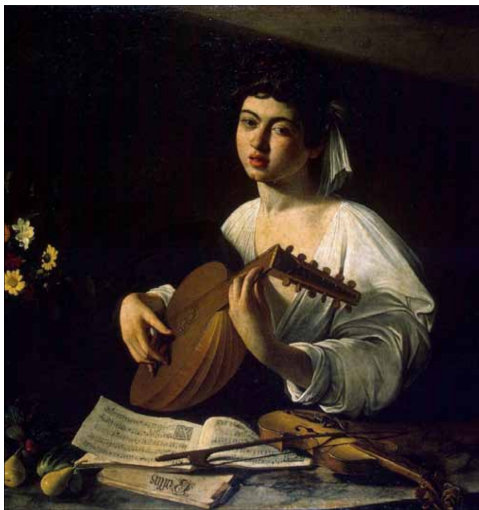
Le joueur de luth, peint par Le Caravage.

Le réseau de médiathèques aura bien besoin d'une semaine pour répondre à cette vaste question. Mais n'allez pas imaginer de vieux professeurs à la barbe blanche venant vous expliquer d'obscures techniques musicales incompréhensibles. On notera d'ailleurs que le public de la musique baroque est de très loin le plus jeune qu'il soit possible de rencontrer dans les concerts dits, par abus de langage, "classiques". Vous connaissez déjà Les 4 Saisons de Vivaldi ou la Tocatta et fugue en ré mineur de Jean-Sébastien Bach (si, si, vous la connaissez !) : cela signifie que vous avez déjà de bonnes bases pour entreprendre ce voyage temporel qui vous emmènera du début du XVII e siècle jusqu'au milieu du XVIII e .