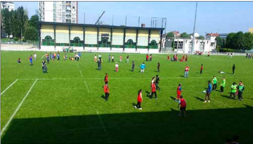
Tournoi de rugby scolaire, en juin dernier.