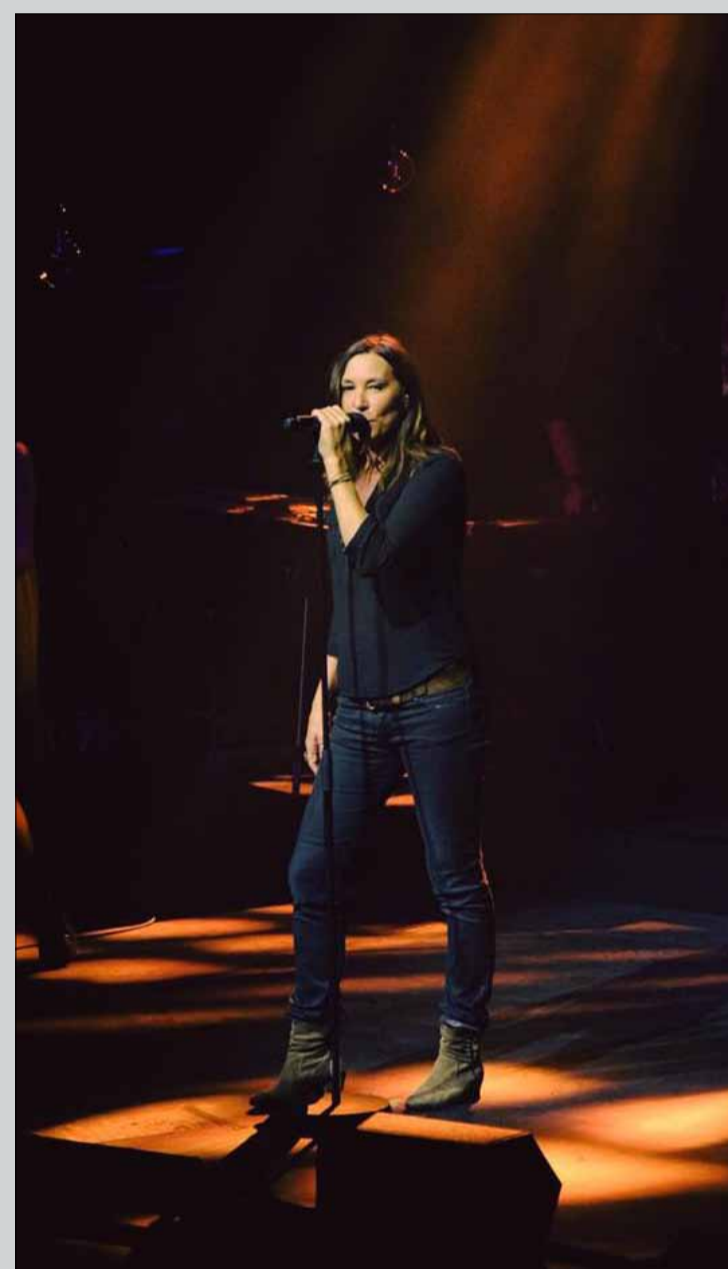
Salle comble pour le concert de Zazie, le 17 octobre.