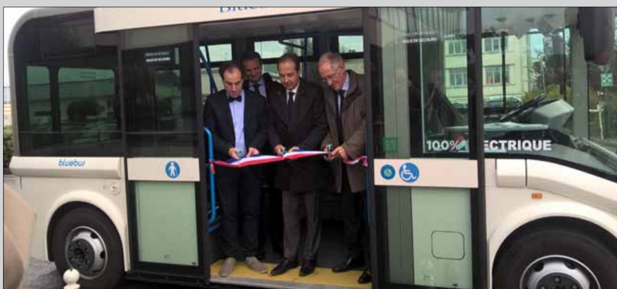
À l'initiative de la Mission emploi, un bus 100% électrique relie la gare RER du Bourget à la plateforme aéroportuaire du Bourget matin et soir. L'objectif : désenclaver l'aéroport, mal desservi par les transport en commun. Il a été inauguré, jeudi 19 octobre, en présence Jean-Christophe Lagarde et de Stéphane Salini, vice-président de la Région. La navette pourra également être mise à disposition des écoles et collèges drancéens pour emmener les élèves au Musée de l'air et de l'espace.