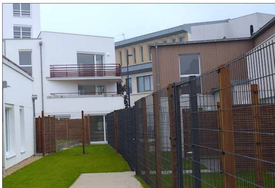
Les 13 pavillons, à l'arrière des résidences Montaigne et Montesquieu.