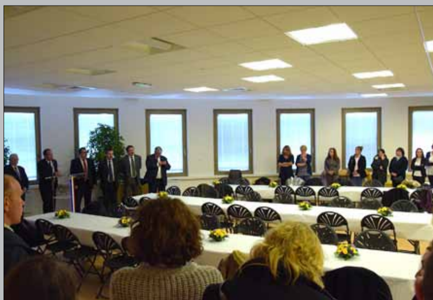
Vendredi 14 octobre, le député-maire, les élus et les services municipaux rencontraient les directions des écoles maternelles et élémentaires...