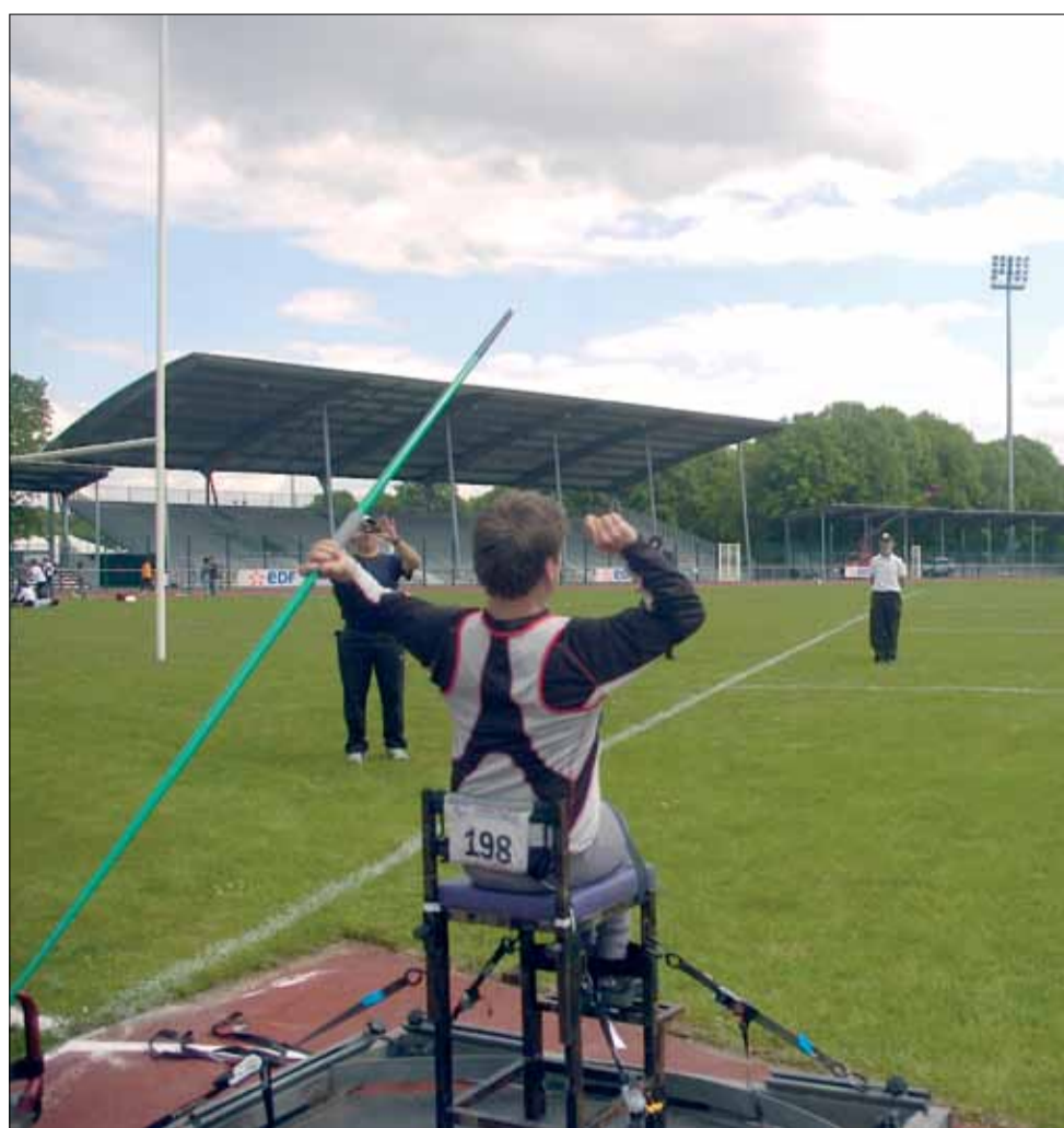
Plusieurs clubs drancéens proposent du handisport et du sport adapté. En juin prochain, Drancy accueillera les meilleures équipes françaises de basket sport adapté, le temps des championnats de France.

Plusieurs associations permettent la pratique du handisport (handicap moteur) et de sport adapté (handicap mental). Certains disposent de sections spécifiques comme l'Athlétisme Le Bourget-Drancy-Dugny Olympique (ABDO). D'autres intègrent les sportifs handicapés à leurs cours traditionnels. Depuis six ans, le Judo Club Drancéen (JCD), le plus gros club de judo de la Ville avec 343 licenciés, compte sept adhérents handicapés mentaux ou moteurs, parmi →