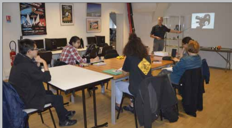
Découverte de logiciels de création graphique avec l'Académie des arts et Science ouverte, au château de Ladoucette. Plus de 40 enfants et adolescents ont participé aux stages de l'Académie.