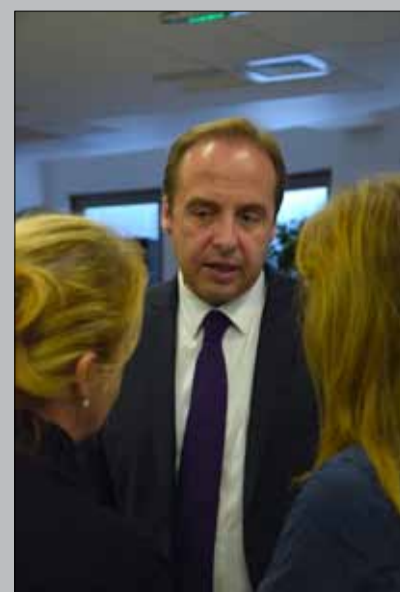
... L'objectif : permettre à tous de bien travailler ensemble.