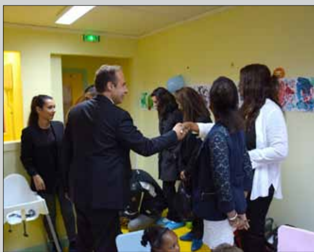
La maison d'assistantes maternelles (MAM), située en centre ville, a été inaugurée vendredi 14 octobre. Ouverte l'hiver dernier, elle accueille dans les 137 m 2 , loués par la Ville, assistantes maternelles et enfants de 0 à 3 ans.