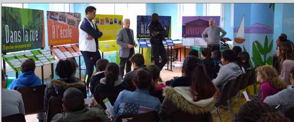
Mercredi 18 octobre, exposition et débat sur la citoyenneté pour les 8-11 ans du service municipal de la Jeunesse.