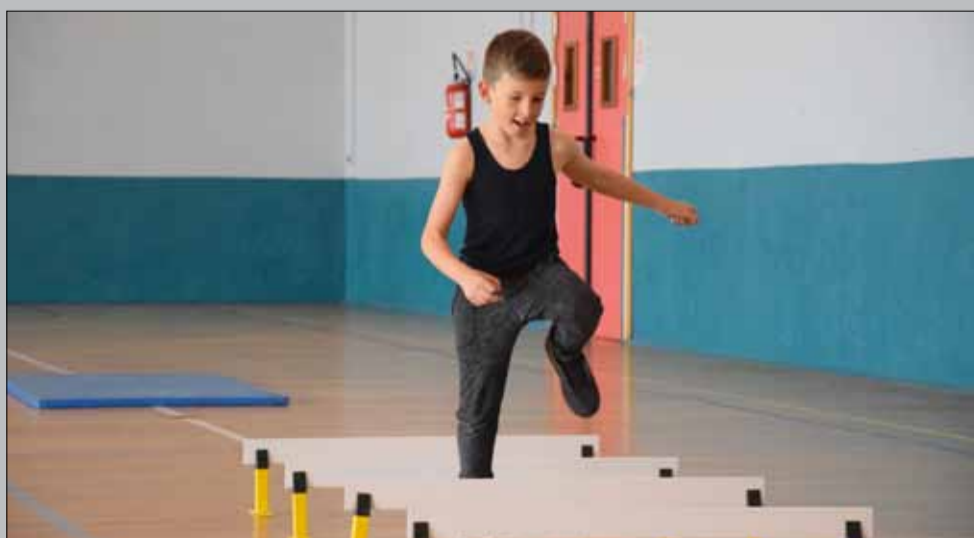
Slackline et crossfit au gymnase Auguste Delaune pour les centres de loisirs avec le service municipal des Sports. Chaque jour des vacances, près de 1000 enfants ont été accueillis dans les centres de loisirs.