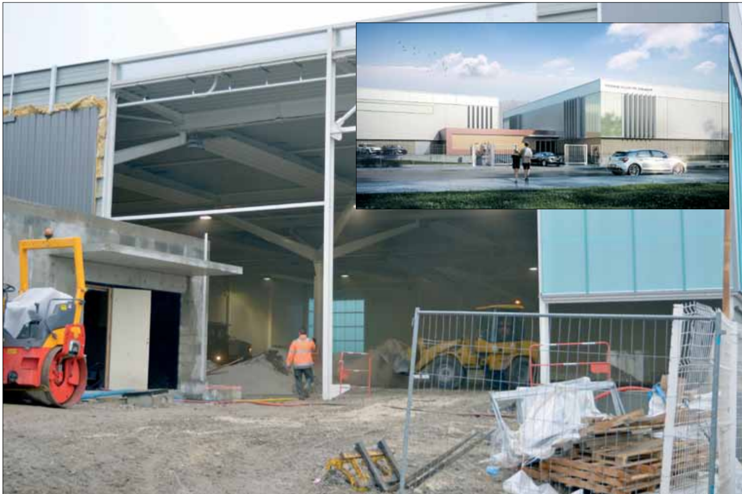
Courts de tennis couverts en construction.