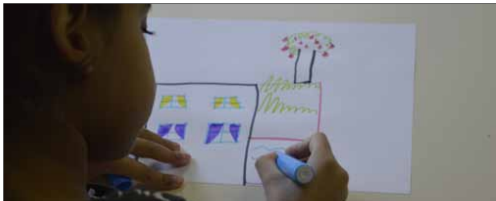
Un peu plus tard, les enfants dessinent le futur Gaston Roulaud.

➔ Maison du projet 120, rue Roger Salengro maisonduprojet@drancy.fr