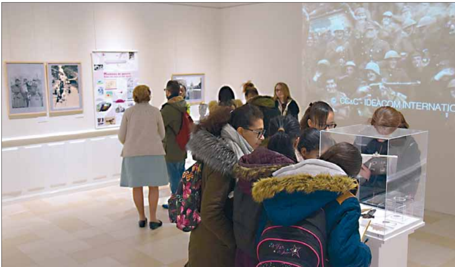
Des collégiens de Pierre Sémard visitent l'exposition.

L'exposition consacrée à la Grande Guerre se poursuit au château jusqu'à fin décembre. Prenez le temps d'y faire un tour.