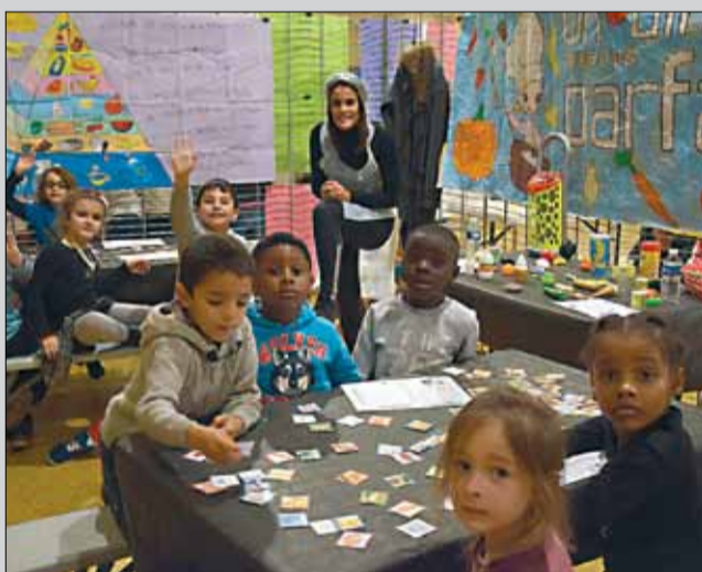
250 enfants des centres de loisirs ont participé à la journée des droits de l'enfant, le 16 novembre.