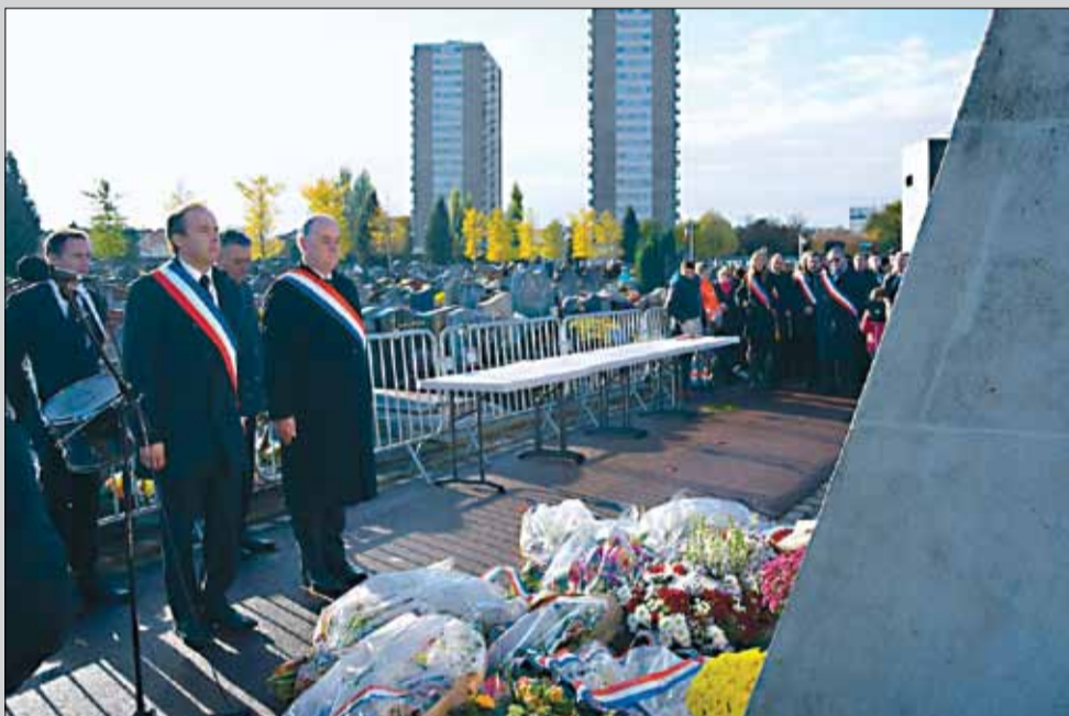
Commémoration de l'armistice du 11 novembre.