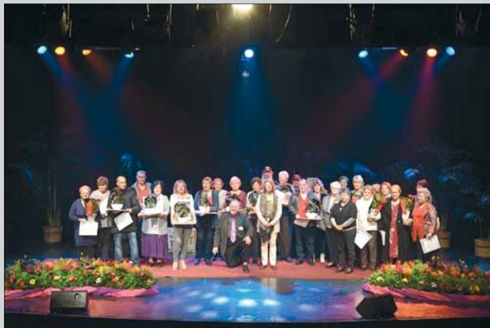
Jeudi 17 novembre, soirée de récompenses pour les jardiniers drancéens.