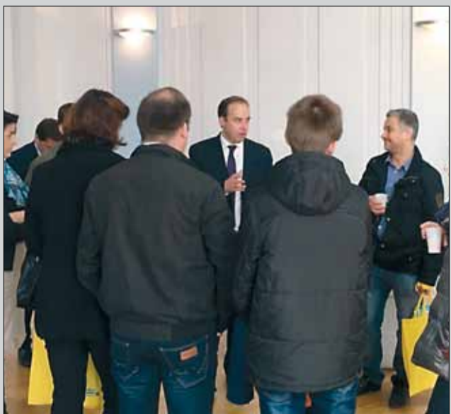
Le 19 novembre, les nouveaux Drancéens étaient invités à la mairie.