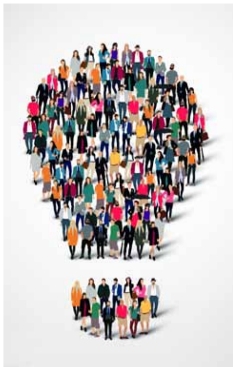
Comment se déroule l'achat groupé d'électricité et de gaz pour les Drancéens ?

Pour être encore plus nombreux et obtenir des prix d'achat d'électricité et de gaz encore plus attractifs, Drancy a décidé de s'associer avec d'autres villes : Besançon a donc rejoint l'achat groupé initié par Drancy, Aulnay-sous-Bois est sur le point de faire de même. Dans un contexte énergétique compliqué, avec une fourniture d'électricité qui s'annonce tendue, il est important d'être dans les meilleures conditions pour négocier. Tous les Drancéens sont donc invités à rejoindre cette opération, et, comme elle est ouverte à tout consommateur d'énergie, à inviter leurs proches, Drancéens ou non, à faire de même.